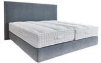
Wandpaneel 0110 mit Passepartout-rahmen ohne Steppung Wandpaneel 0106 ohne Passepartout-rahmen ohne Steppung