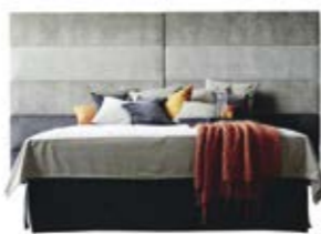
Wandpaneel 0126 , 5 Raster, o. Teilung Wandpaneel 0126 , 5 Raster, mittig geteilt (ab B 330 cm nur mittig geteilt erhältlich)