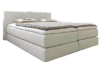
Wandpaneel 0120 , soft gepolstert mit Kederkante, mit schwebender Optik