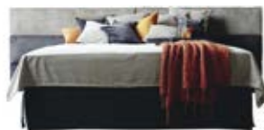
Wandpaneel 0124 , 3 Raster o. Teilung Wandpaneel 0124 , 3 Raster, mittig geteilt (ab B 330 cm nur mittig geteilt erhältlich)