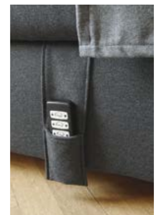
Eine praktische Klett-tasche beherbergt die handliche - optional auch kabellos erhältliche - Fernbedien-ung