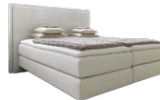
Wandpaneel 0113 mit Passepartout-rahmen mit Rautensteppung Wandpaneel 0109 ohne Passepartout-rahmen mit Rautensteppung