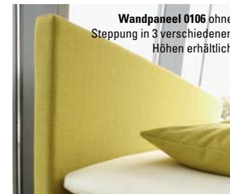
Wandpaneel 0106 ohne Steppung in 3 verschiedenen Höhen erhältlich