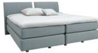
Kopfteil 0132** mittig geteilt mit vertikaler Steppung