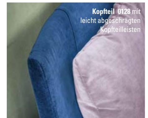
Kopfteil 0128 mit leicht abge-schrägten Kopfteil-leisten