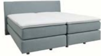
Kopfteil 0128* mit leicht abge-schrägten Kopfteilleisten