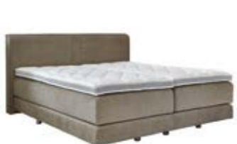
Wandpaneel 0119 mit handwerklich eingearbeitetem Keder