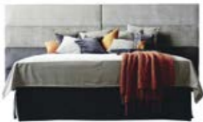
Wandpaneel 0125 , 4 Raster o. Teilung Wandpaneel 0125 , 4 Raster, mittig geteilt (ab B 330 cm nur mittig geteilt erhältlich)