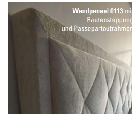
Wandpaneel 0113 mit Rautensteppung und Passepartout-rahmen