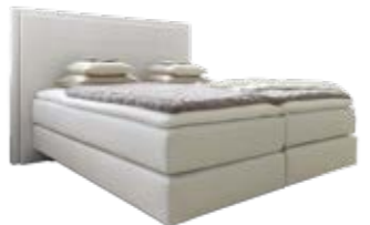
Wandpaneel 0111 mit Passepartout-rahmen mit Stegsteppung Wandpaneel 0107 ohne Passepartout-rahmen mit Stegsteppung