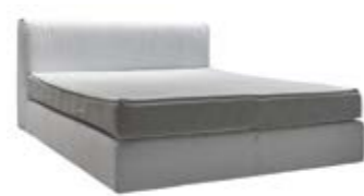
Kopfteil 135 mit gelegter Falte und softer Komfortpolsterung