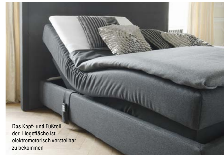
Das Kopf- und Fußteil der Liegefläche ist elektromotorisch verstellbar zu bekommen