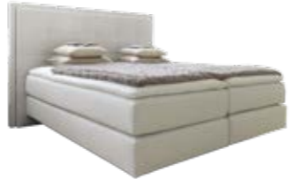
Wandpaneel 0112 mit Passepartout-rahmen mit quadratischer Steppung Wandpaneel 0108 ohne Passepartout-rahmen mit quadratischer Steppung