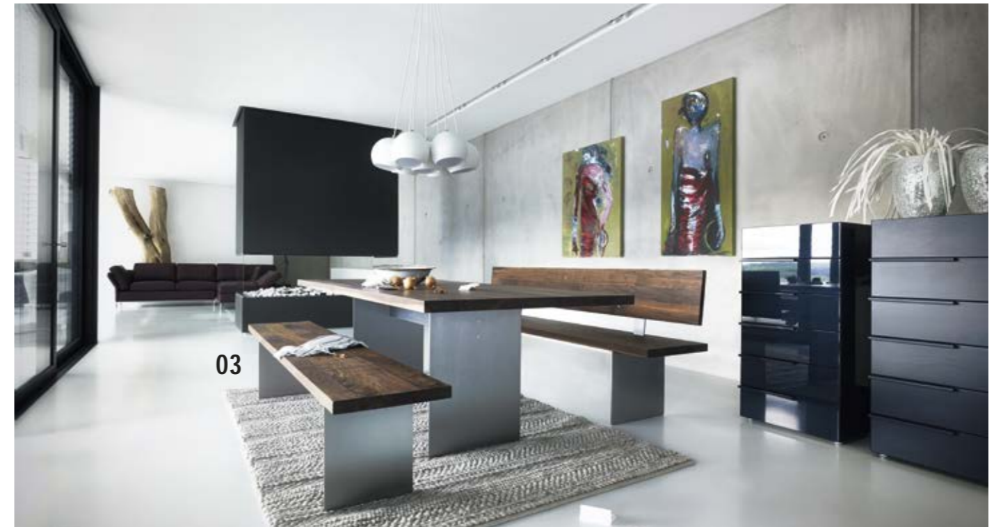
03 Die Bank ist mit und ohne Rückenlehne erhältlich, die Metallteile sind hier auf den Rest des Tischensembles abgestimmt.