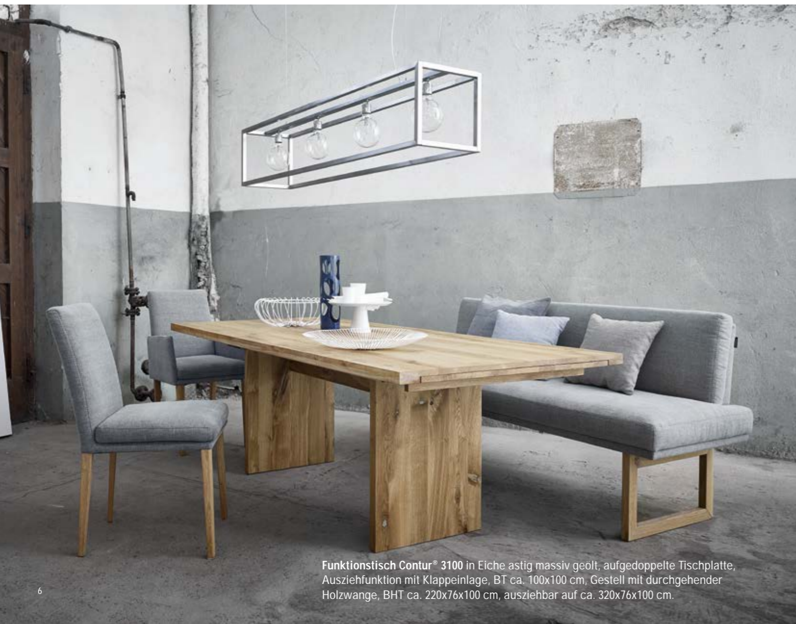
Funktionstisch Contur® 3100 in Eiche astig massiv geölt, aufgedoppelte Tischplatte, Ausziehfunktion mit Klappeinlage, BT ca. 100x100 cm, Gestell mit durchgehender Holzwanne, BHT ca. 220x76x100 cm, ausziehbar auf ca. 320x76x100 cm.