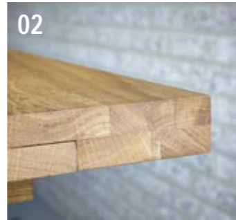
02 Eingefahren verbleibt selbst an der Auszugsseite nur eine schlichte, fast nicht sichtbar Fuge zu sehen.

ZU EINEM TISCH GEHÖREN AUCH SITZGELEGENHEITEN, DAS KÖNNEN STÜHLE SEIN ODER EBEN DIE PASSENDE BANK. DIESE IST OPTISCH ABGESTIMMT AUF DEN TISCH UND MIT ODER OHNE RÜCKENLEHNE ERHÄLTICH.