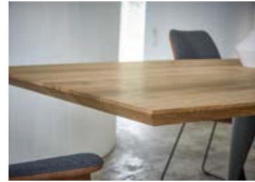
Handwerk in Perfektion – aus einem Rohr geschnitten. 01. Tisch Contur® 3100 in Eiche astig massiv, Pigmentfüllung braun, Platte 40 mm stark, mit Schweizer Kante, Gestell gedreht, schwarz pulverbeschichtet, Tischplatte und Bodenplatte in Bootsform, BHT ca. 220x76x100 cm