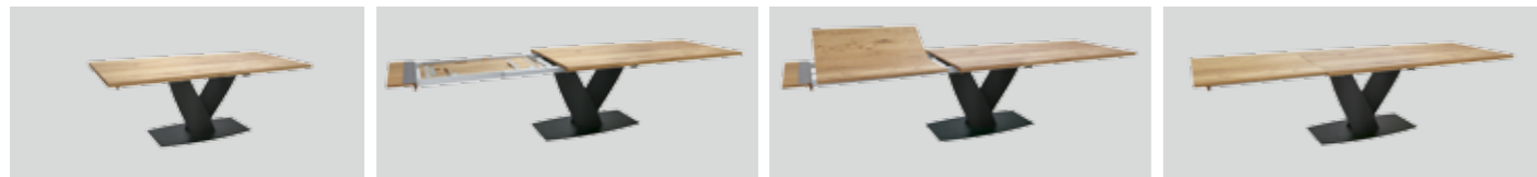
Auszugstisch Contur® 3100 mit gerader Platte und einer Klappeinlage