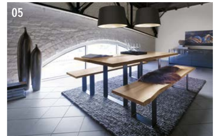
05... mit der Metallkufe in den entsprechenden Ausführungen