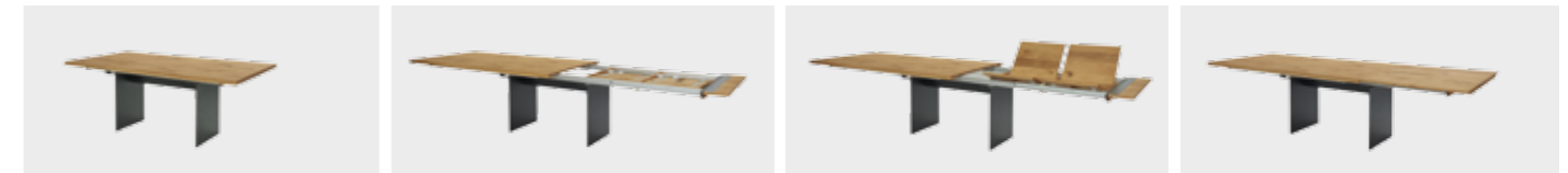
Auszugstisch Contur® 3100 mit gerader Platte und zwei Klappeinlagen