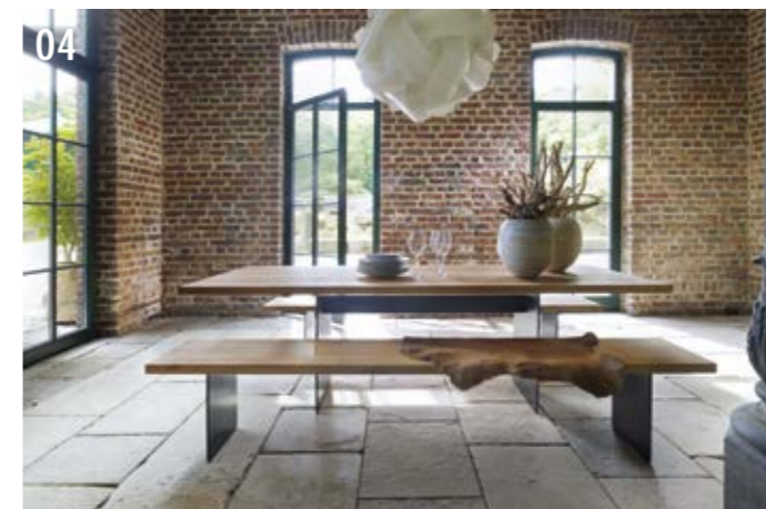
04 Die Bank kann mit der normalen Metall-, Holz- oder Halbmond-Wange versehen sein oder ...