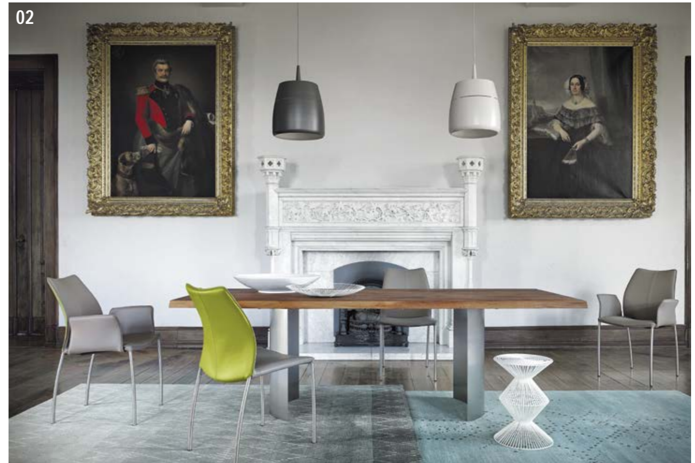
02. Tisch Contur® 3100 , Platte in astigen amerikanischen Nussbaum, einteilig, Plattenstärke ca. 42 mm, mit Waldkante, Gestell halbrund, Edelstahl geschliffen, BHT ca. 220x76x100 cm