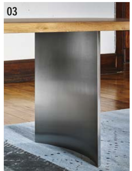
03 Das Untergestell Wange halbrund gebogen, ist ausschließlich in der Ausführung Edelstahl geschliffen erhältlich.