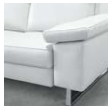
Bodenfrei SY (Verstellung optional)