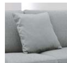
Kissen in verschiedenen Formaten