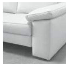
Bodennah SZ (Verstellung optional)